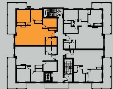
PLAN CLÉ 2e, 3e & 4e ÉTAGES